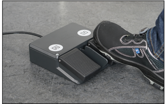
Pedaleinheit zum Öffnen und Schließen pneumatischer Probenhalter per Fuß